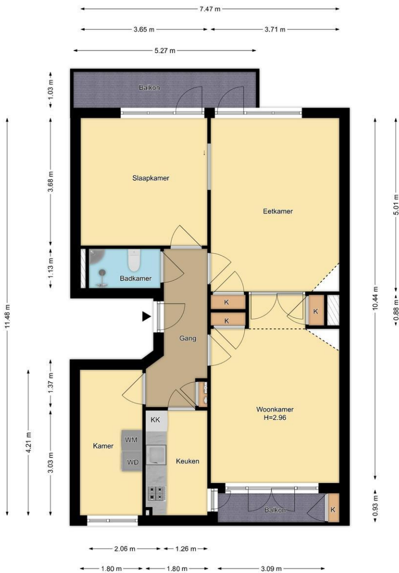
Appartement Bos En Lommerweg 323-2, Amsterdam R.M. Vastgoedpresentatie| Aan deze plattegrond kunnen geen rechten worden ontleend